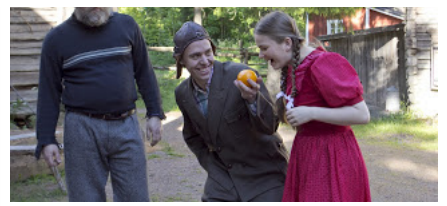
Kaisu näkee elämänsä ekan appelsiinin!

Plussaa siitä että tässä esityksessä ei juostu alasti puskissa, tai ylenpalttisesti muutenkaan liikuttu navanalusvitseissä. Hyvää huumoria oli paljon, pikkutuhmaakin, ja viina virtasi hetkittäin. Mutta henkilöhahmot olivat elämänmakuisia, ja näyttelijät kaikki oikeinkin laadukkaita. Rekvisiitta oli kovin autenttisen oloista 50-luvulta, erityisen sympaattinen yksityiskohta yhtiön auton toiminut Nalle-Sisu lava-auto. Ja vanhat lastenvaunut! Kyläläisten suhtautuminen sähköön ihmeisiin oli liikuttavaa, miten se sillälailla ilmaantuu ja katoaa napista painamalla. Puvustus (Sirkka Salon käsialaa) oli myös todella kaunista katsottavaa. Miljööstäkään ei voi valittaa, meinaan Köyliön Torpparimuseon pihapiiriin oli rakennettu toimiva ja kiva katsomo (katettu!) ja museon rakennusten ympärille näyttämö, vain pienillä lisäsäädöillä. Ja enpä ole ennen törmännyt maantien kiertotiehen teatteriesitysten aikana. Lisäpisteet ilmaisista käsiohjelmista ja fiksusti rakennetuista jalkatelineistä katsomossa. Niin ja siitä että lippukassalle kävi pankkikortti.